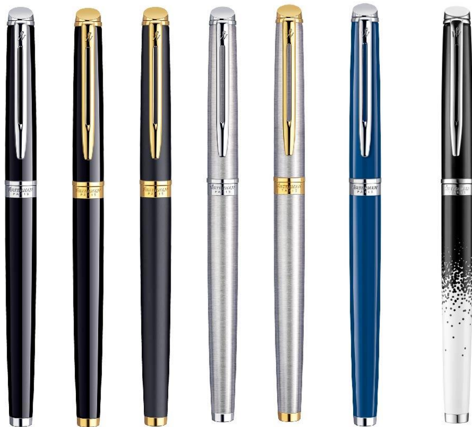
Negro CT Negro GT Negro CT Acero Acero Blue Ombres et Matte Inoxidable Inoxidable Obsession Lumières CT GT

HÉMISPHERE es la elegante y sofisticada pluma estilizada ideal para todos los días y todas las ocasiones. Intemporales y contemporáneos, los acabados de HÉMISPHERE Essential van más allá de la modernidad y el refinamiento con el color blanco óptico.