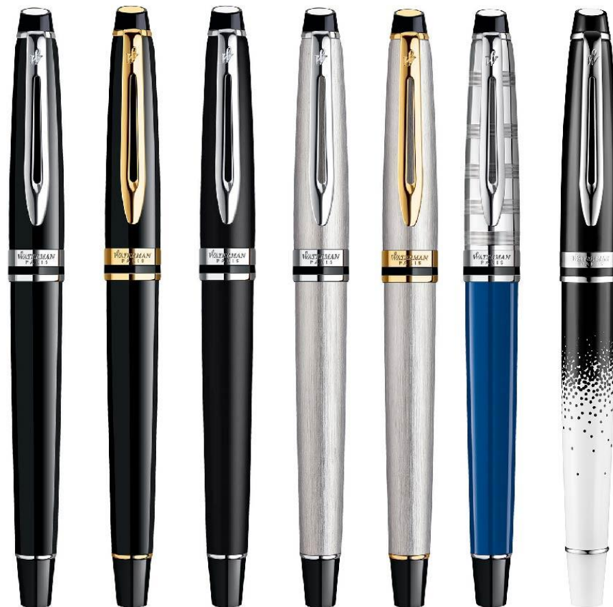
Negro CT Negro GT Negro CT Matte Acero Acero Blue Ombres et Inoxidable Inoxidable Obsession Lumières CT GT

Expert es la pluma de negocios ideal para quienes admiran un diseño audaz y se sienten orgullosos de sus objetos personales de uso diario.