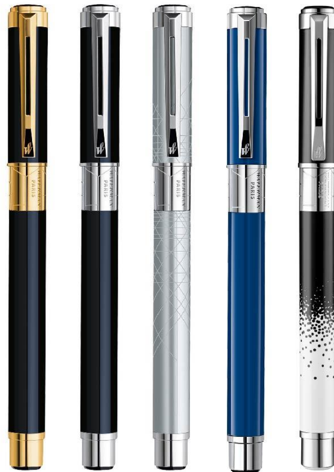
Negro GT Negro CT Deco Silver Blue Obsession Ombres et Lumières

Sus líneas finamente grabadas le aportan el aura enérgica de un rascacielos futurista.